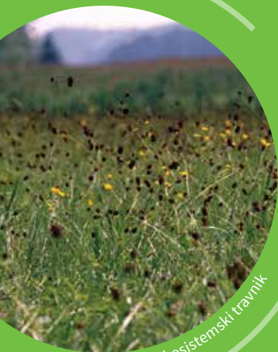
Nižinski ekosistemski travnik

Tako pomembno pripomorete k ohranjanju življenjskega prostora teh travniških posebnosti.