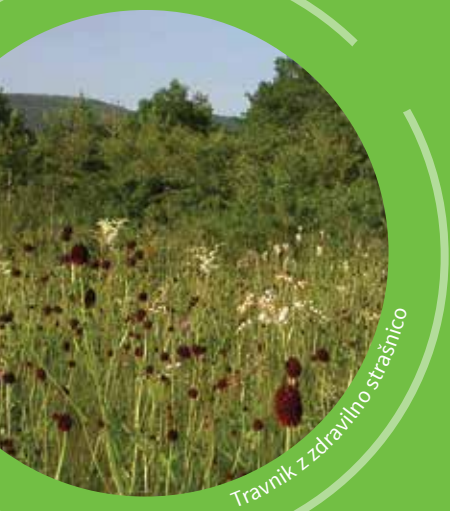
Travnik z zdravilno strašnico

Tako pomembno pripomorete k ohranjanju življenjskega prostora barjanskega okarčka in drugih travniških vrst.