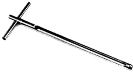
Slika 1. Sonda za jemanje talnih vzorcev